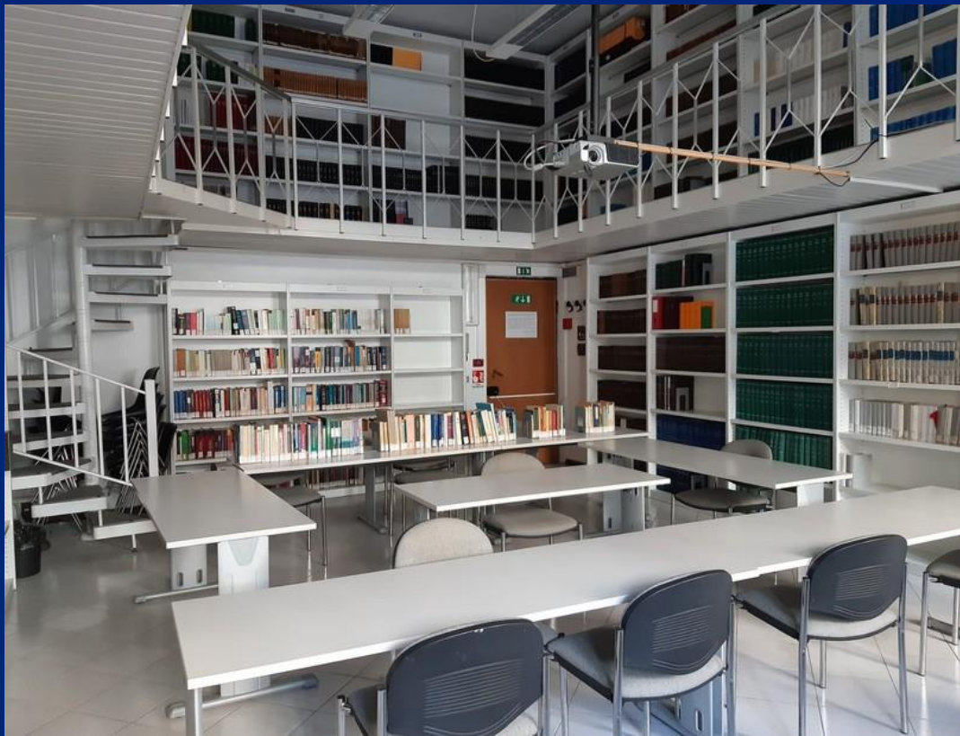
Biblioteca di Scuola di Scienze Sociali - Sede di Giurisprudenza "P.E.Bensa". Università di Genova Via Balbi 130r | 16126 Genova Tel: 010 2099883 email: bibliogiurisprudenza@unige.it