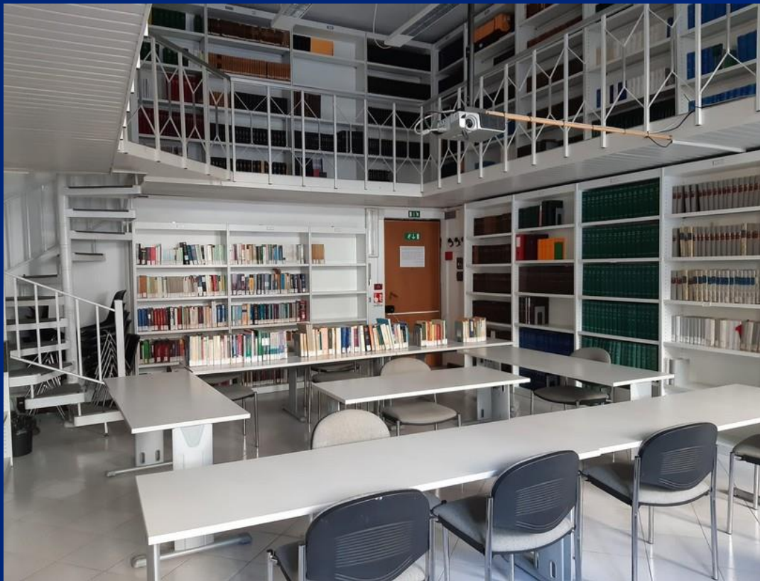
Biblioteca di Scuola di Scienze Sociali - Sede di Giurisprudenza "P.E.Bensa". Università di Genova Via Balbi 130r | 16126 Genova Tel: 010 2099883 email: bibliogiurisprudenza@unige.it